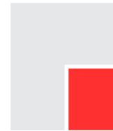
D104BS 113 x 145 mm