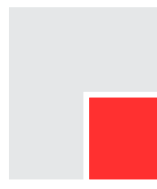
D104BS 102,5 x 135