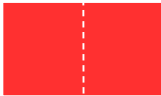
S101V 450 x 285 mm