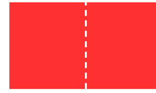
S101V 440 x 280 mm