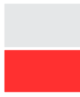
D102VL 210 x 135