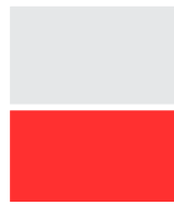
D102VL 225 x 138 mm