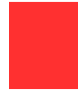
D101V 230 X 295 mm